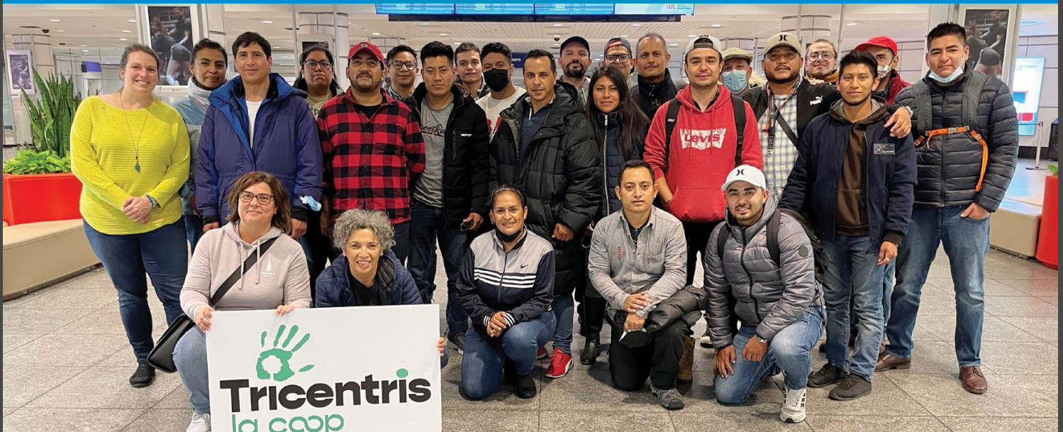
Nos nouveaux Tricentrisiens à leur arrivée à l'aéroport de Montréal.