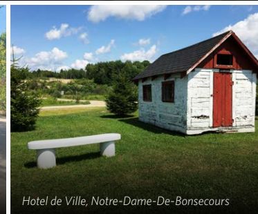
Hotel de Ville, Notre-Dame-De-Bonsecours