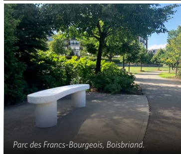
Parc des Francs-Bourgeois, Boisbriand.